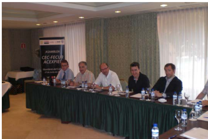
Asamblea CEC-FECUR / ACEXPIEL 2008

-En Montbrío del Camp (Tarragona), 27 de junio de 2008