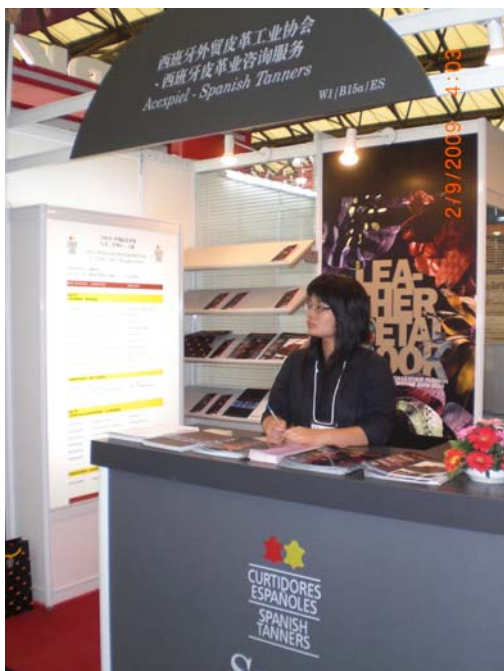
Stand de ACEXPIEL, en la pasada edición de ACLE (Shanghai)