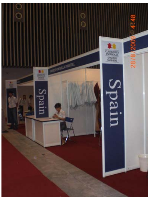
Shoes & Leather Vietnam

Entre el 27 y 29 de Agosto se celebró la 11ª edición de la Feria Internacional de Calzado y Piel en Ho Chi Minh, Vietnam. En ella han participado 110 expositores de 16 países cubriendo todos los sectores relacionados con la piel: maquinaria para calzado y curtidos, curtidos, pieles en bruto, componentes para calzado, productos químicos, accesorios y producto acabado.