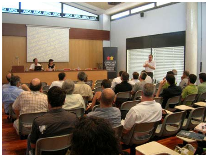
Sala de Actos de AIIICA, durante la presentación de Tendencias Otoño-Invierno 10/11 por parte de EFD.

En la presentación de Barcelona, el European Fashion Design Center (Florencia), también presentó por primera vez las tendencias en colores, texturas y acabados en piel, desarrollados por empresas químicas proveedoras del sector curtidos. El European Fashion Design Center (EFD) presenta sus desarrollos periódicamente dos veces al año en Florencia.