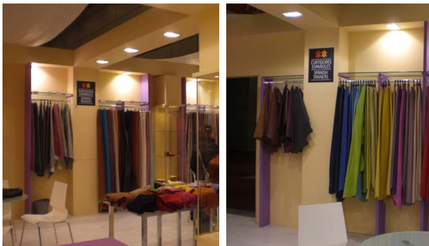
Stands durante la pasada edición de Lineapelle

Entre los días 16 al 18 de marzo, se ha celebrado la primera edición de Lineapelle 2010 en la ciudad italiana de Bolonia. Lineapelle es la feria más importante del sector en Europa, punto de encuentro donde se cita todo profesional relacionado con el mundo del curtido.