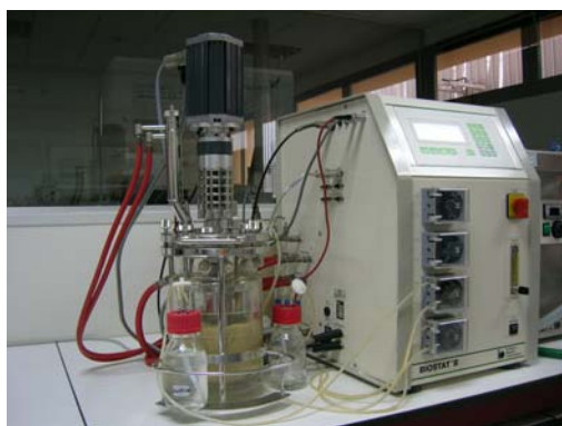
Bioreactor utilizado para la hidrólisis enzimática del colágeno

La Confederación Española de Curtidores CEC-FECUR y el Centro Tecnológico AIICA, como representantes institucional y técnico respectivamente de la industria del curtido española, han llevado a cabo durante el período 2008-2009 el proyecto "Mejora del poder blanqueante y del rendimiento de la tintura mediante aplicación de hidrolizados proteicos sobre algodón y cuero de curtición al cromo".